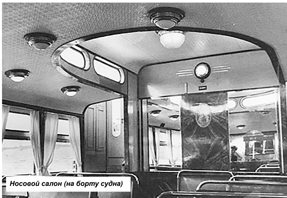
Носовой салон (на борту судна)