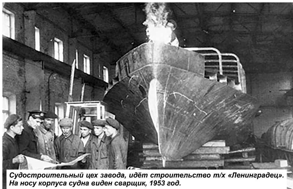
Судостроительный цех завода, идёт строительство т/х «Ленинградец». На носу корпуса судна виден сварщик, 1953 год.

Шлиссельбургские судоремонтные мастерские были открыты по приказу Министерства путей сообщения от 4 ноября 1913 года. Однако организационно его существование узаконили 6 ноября, когда вышло «Положение об организации, производстве работ и отчетности казенных ремонтных мастерских для судового и землечерпательного каравана Петербургского округа Министерства путей сообщения». Именно эта дата и считается днем рождения Невского завода.