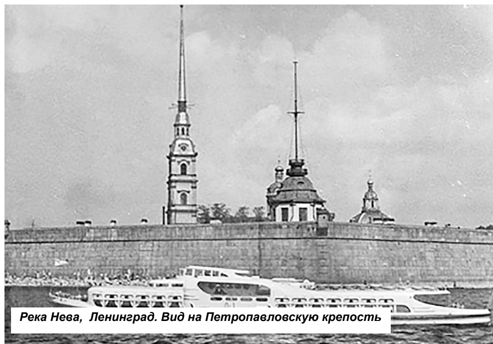
Река Нева, Ленинград. Вид на Петропавловскую крепость

Главной задачей мастерских стал судоремонт казенных пароходов, землечерпательных и других судов.