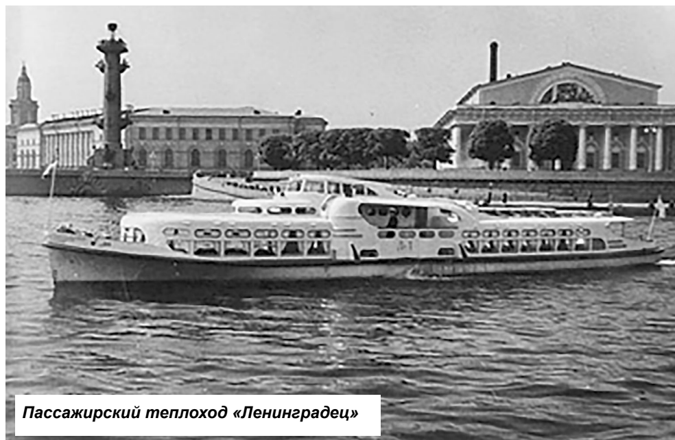
Пассажирский теплоход «Ленинградец»