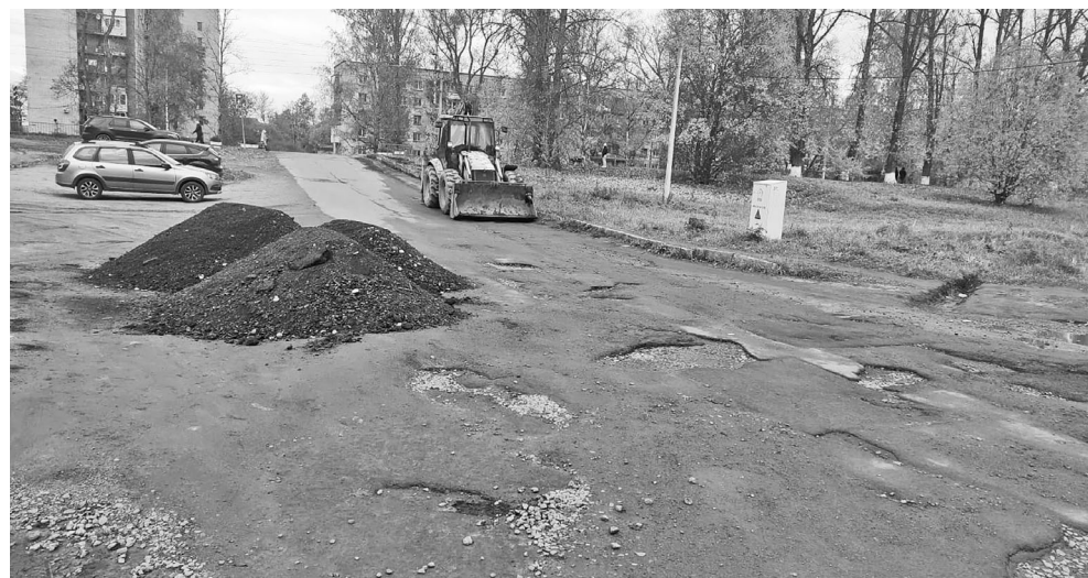
должить ремонтно-восстановительные работы по адресам: ул. Малоневский канал д.№6, Малоневский канал д.№10, Малоневский канал д. №12 к.1и к.2.