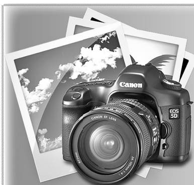
ФОТО НА ДОКУМЕНТЫ от 300 руб.

В настоящий момент для получения вышеперечисленных услуг необходимо обращаться по телефону: 8 (981) 003-71-71 (ежедневно с 9:00 до 17:00). По всем вопросам, связанным с оказанием ритуальных услуг на территории МО Город Шлиссельбург обращаться в МКУ «Управление городского хозяйства и обеспечения» по телефону: 8 (813-62) 77-752.