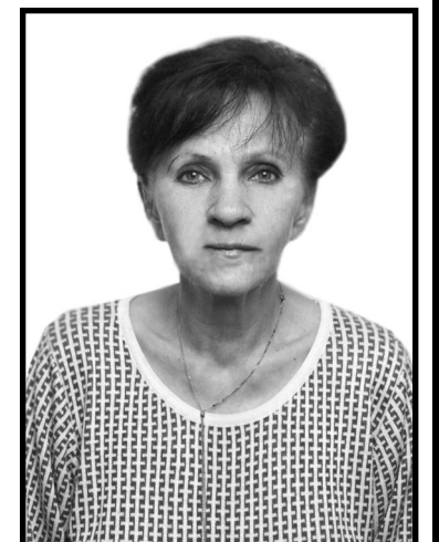
Инф. «НИ»